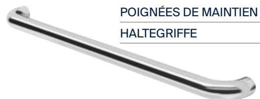
POIGNÉES DE MAINTIEN HALTEGRIFFE