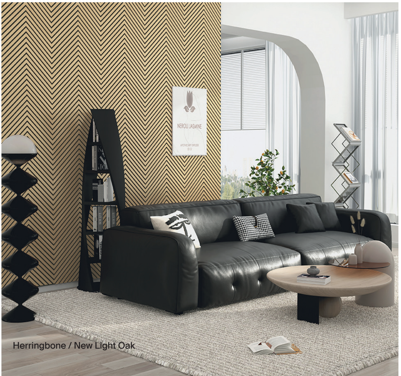
Herringbone / New Light Oak