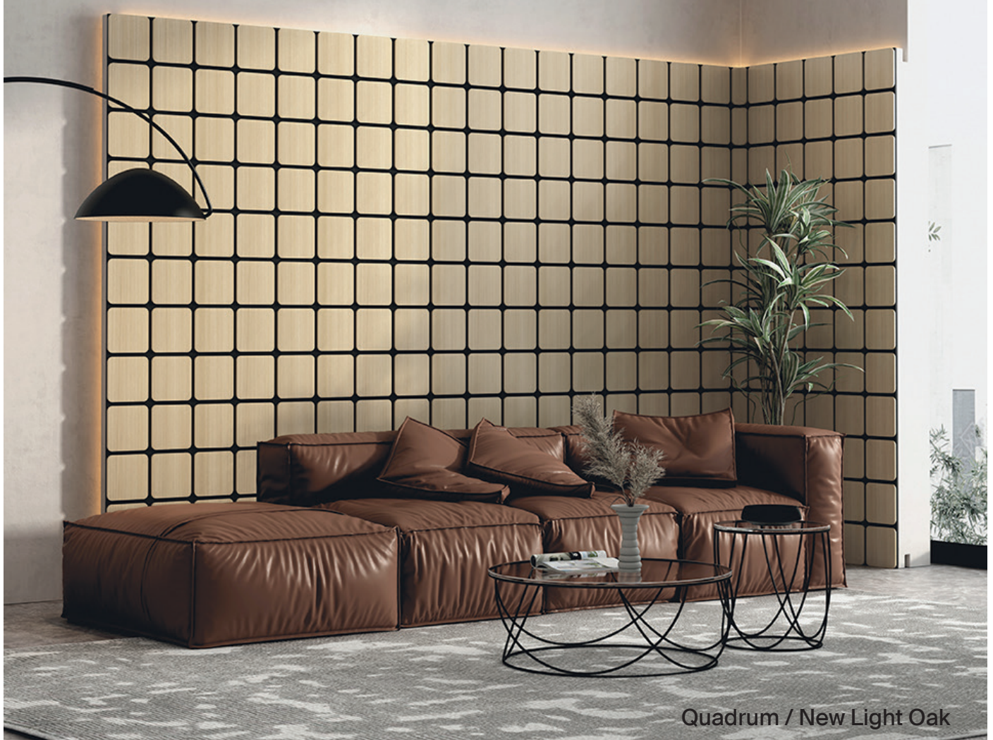
Quadrum / New Light Oak