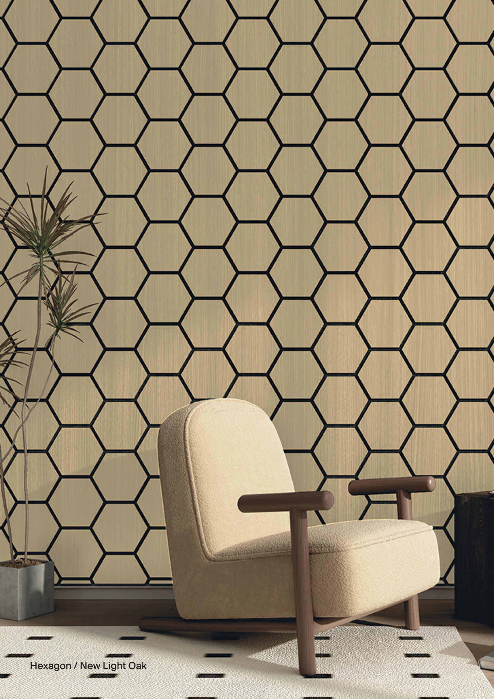
Hexagon / New Light Oak