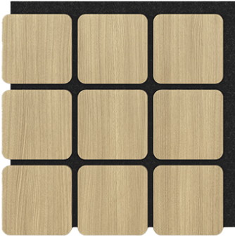
New Light Oak #106207721