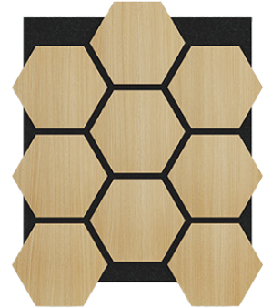
New Light Oak #106207722