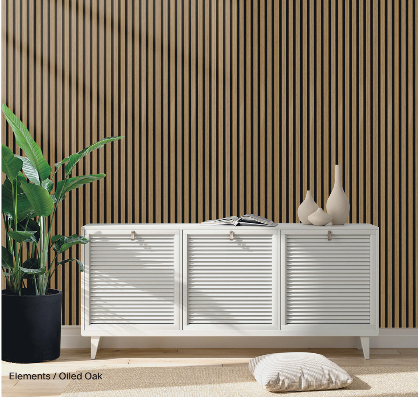
Elements / Oiled Oak