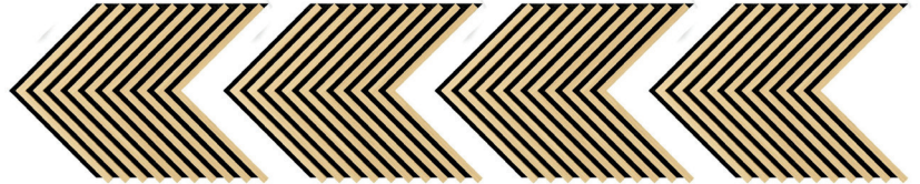
New Light Oak #106207723

2750 x 520 mm / x1 (4) = 1,430 m 2 / 23310094